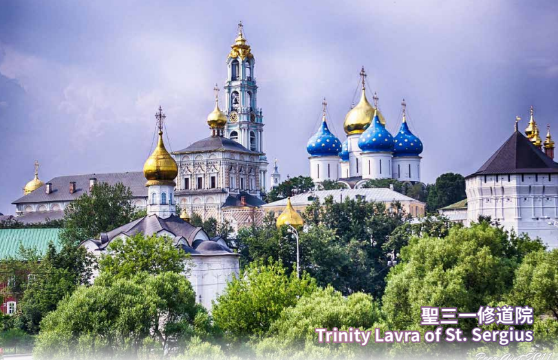
聖三一修道院 Trinity Lavra of St. Sergius