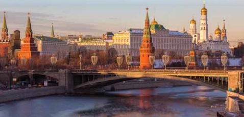
克里姆林宮 Kremlin Palace

After breakfast, heading to one of the most popular destination in Russia - The Red Square and its surrounding area such as Unsung Hero Monuments, Saint Basil's Cathedral, Alexander Garden as well as the popular GUM Department. After lunch, visit to the Moscow Kremlin (inside) which meant City in the City. In the evening, enjoy a fascinating Circus & Acrobatic Show (An alternate arrangement will be made should this become unavailable). (B/L/D)