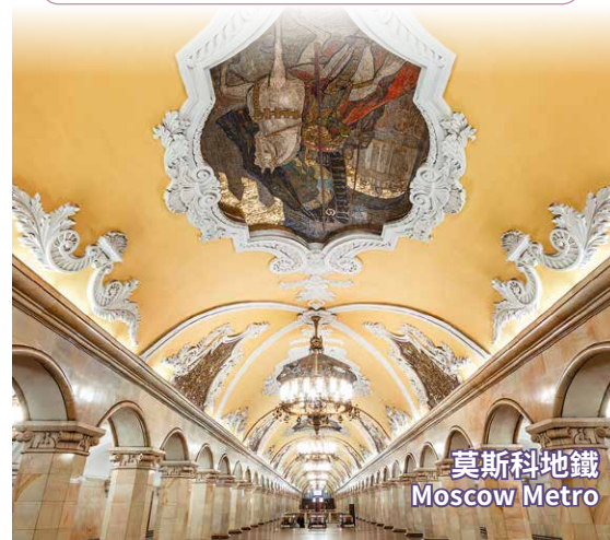
莫斯科地鐵 Moscow Metro