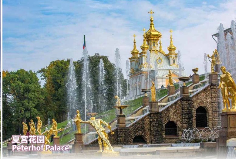
夏宮花園 Peterhof Palace

(入內) 是 1968 年所建的木造建築博物館。整個博物館是露天的，有冬天教堂、夏天教堂，還有民宅及商店，一旁還有傳統水井、水車、以及磨麵粉用的風車，仿佛幾百年前的俄羅斯小鎮重現眼前。在弗拉基米爾享用特色俄式午餐。下午遊覽著名的【金門】(外觀)，是唯一殘存的中世紀城門，它模仿基輔金門，建造於 12 世紀中葉的一座城門。如今縱觀整條繁華街道，它依然是弗拉基米爾的象徵性建築；烏斯別斯基教堂【聖母修道院】(外觀)，【德米特裡教堂】(外觀)。隨後乘車返回蘇茲達里，參觀【小克林姆林宮】(入內)* 宮內著名的基督誕生大教堂就是 13 世紀的建築，5 個藍色洋蔥形巨頂，頂面有無數金星，堂身為奶白色，配上高聳的鐘樓，造型十分調和。晚上，不想走路的話，可以來趟三頭馬車“Troika”之旅 (USD$12/人，每車可乘 4 人)。(早/午/晚餐)