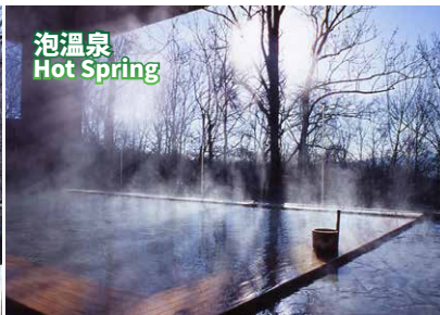
泡溫泉 Hot Spring