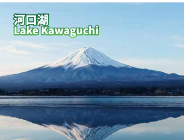
河口湖 Lake Kawaguchi