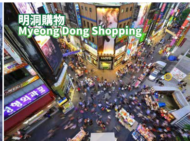
明洞購物 Myeongdong Shopping