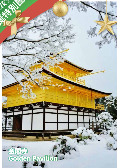
金閣寺 Golden Pavilion