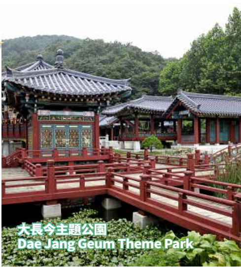
大長今主題公園 Dae Jang Geum Theme Park