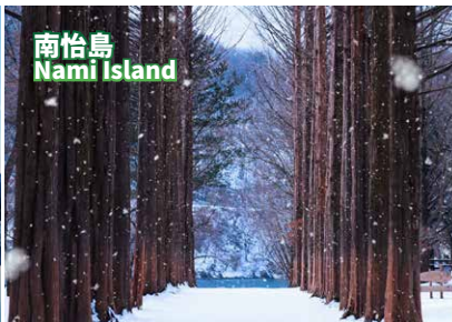
南怡島 Nami Island