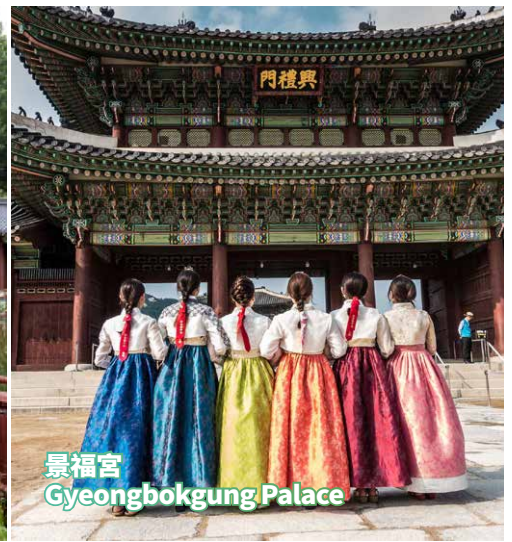
景福宮 Gyeongbokgung Palace

Pay a short visit to the 38th parallel north (Imjingak, Bridge of freedom, Mangbaeddan). Then, visit Gyeongbokgung Palace, with the