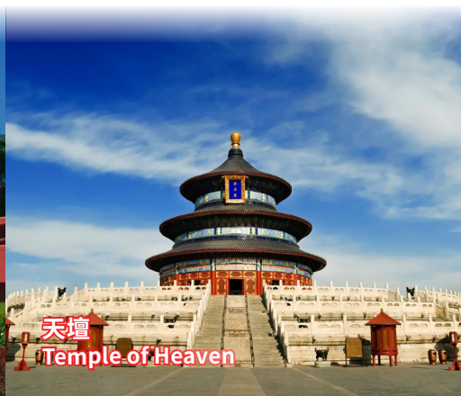
天壇 Temple of Heaven